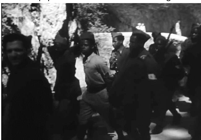
Arrivée des Tirailleurs Sénégalais sur le plateau du Vercors